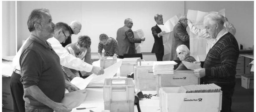
Es war einiges zu tun beim Öffnen der Wahlbriefe

Die Vertreterversammlung ist das von den Mitgliedern gewählte Beschlussorgan der Kammer. Sie besteht aus 125 Mitgliedern, wobei mindestens 75 von ihnen Pflichtmitglieder sind. Die 6.536 stimmberechtigten Mitglieder der Bayerischen Ingenieurekammer-Bau waren vom 20. September bis einschließlich 11. Oktober 2016 aufgerufen, über die Besetzung der VII. Vertreterversammlung abzustimmen. Es wurden 2.788 gültige Stimmzettel abgegeben. Die Auszählung fand am 12. und 13. Oktober statt.