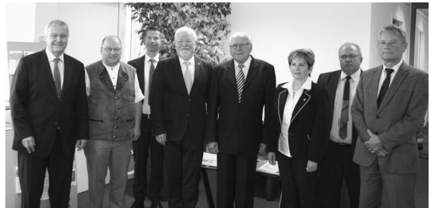
Ungarische Delegation zu Gast in München.

Die ungarischen Gäste interessierten sich besonders für das bayerische Fortbildungssystem. Die ungarische Kammer schreibt in ihrer Satzung eine Fortbildung in rechtlichen wie fachlichen Themen vor. Die Zusammenstellung der Themen, die Auswahl der Re-