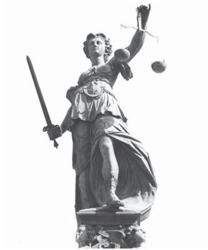
Verbrauchervertrag: Schutz für Häuslebauer

Die Darstellung der Baubeschreibung muss klar und verständlich sein