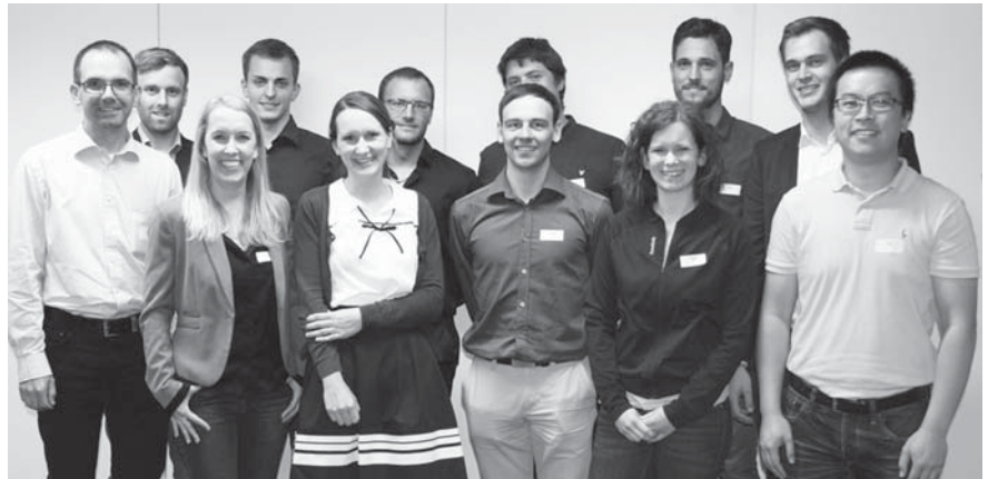
Stolz blicken die Trainees nach der Zertifikatsvergabe in die Zukunft.

Ziel des kompakten berufsbegleitenden Qualifizierungsprogrammes ist es, vielversprechenden Nachwuchskräfte und Potenzialträger gezielt auf die Übernahme verantwortungsvoller Aufgaben und Positionen vorzubereiten