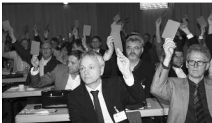
Klares Votum für die Resolution zur Novellierung der HOAI

In ihrer Sitzung vom 25.04.2013 handelte die Vertreterversammlung sofort und verabschiedete die nebenstehend im Wortlaut abgedruckte Resolution.