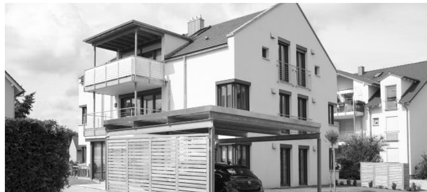
Das preisgekrönte Haus in Bad Staffelstein

Sehr, sehr positiv, mit großer Anerkennung von allen Seiten, sei es bei Berufskollegen, aber auch von der Bevölkerung und der heimischen Presse. Wir sind ja hier im Landkreis Lichtenfels zur Gesundheitsregion ernannt worden. Da passt dieses Pilotprojekt wunderbar dazu.