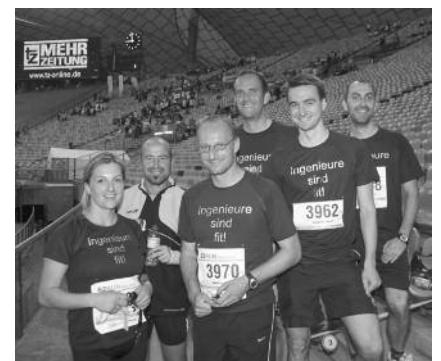
Läufer aus dem Kammer-Team 2012