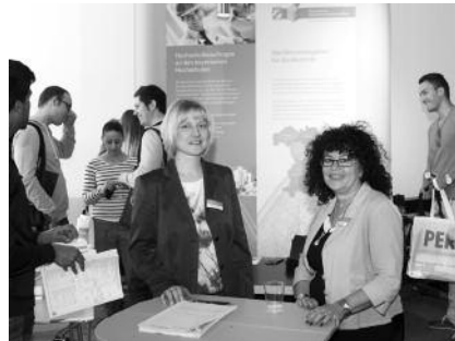
Kammermitarbeiterinnen im Gespräch mit Studenten

Nach der Diskussionsrunde nutzen viele Studenten die Möglichkeit, sich am Stand der Bayerischen Ingenieurekammer-Bau über die Aufgaben der Kammer und über offene Praktikumsplätze und Stellen für Absolventen bei den Firmen der Kammermitglieder zu infor-