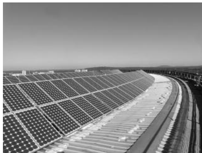
Photovoltaikanlage in luftiger Höhe

Das Themenspektrum reicht von der energetischen Sanierung von Bestandsgebäuden bis zur CO 2 -neutralen Wärmeversorgung. Es werden Lösungen mit Photovoltaik, Wasserkraft, Solarthermie, Geothermie sowie neu gebaute Plusenergiehäuser und vieles mehr vorgestellt. Auch Möglichkeiten