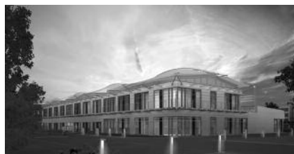
Das ZAE in Würzburg Foto: Lang Hugger Rampp GmbH Architekten