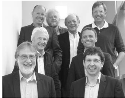
Der Ausschuss Öffentlichkeitsarbeit

Um dieser Herkules-Aufgabe gerecht zu werden, braucht es einen langen Atem und viele kleine Schritte. Turnusmäßige Aufgaben wie die Erarbeitung