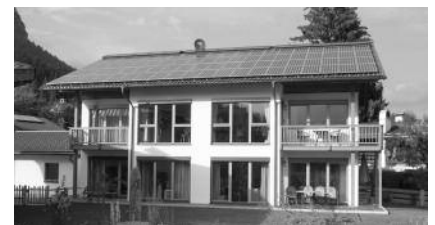
Plusenergiehaus in Garmisch-Partenkirchen