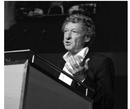
Dipl.-Ing. Hermann Tilke über den Bau von Rennstrecken