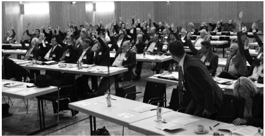
Die Vertreterversammlung war sich einig und verabschiedete bei ihrer achten Sitzung die Resolution Bauingenieurstudiengänge.

Die zunehmend ausufernde Ausdifferenzierung von Studiengängen sieht die Kammer sehr kritisch. Daher hat der Kammervorstand gemeinsam mit den Ausschüssen und Arbeitskreisen die Resolution Bauingenieurstudiengänge vorbereitet, die jetzt von der Vertreterversammlung beschlossen wurde. Darin fordert die Bayerische Ingenieurekammer-Bau eine grundständige, breit angelegte Ausbildung im Studium Bauingenieurwesen.