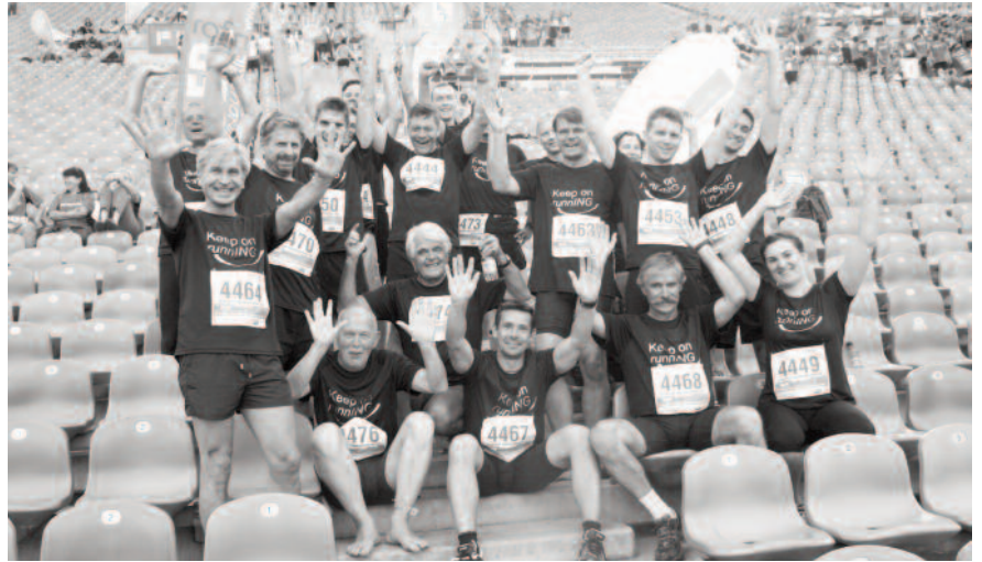
Das Läufer-Team der Kammer beim B2Run 2014.