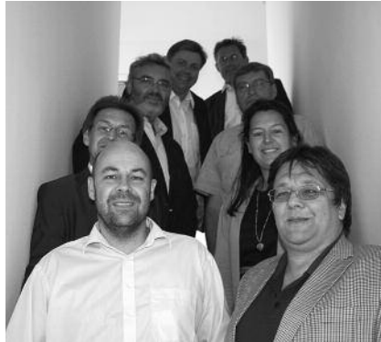
Die Mitglieder des Arbeitskreises Nachhaltigkeit in der kommunalen Infrastruktur.

D er Wert der kommunalen Infrastruktur ist im öffentlichen Bewusstsein nicht ausreichend verankert. Mangelnder Erhalt führt oft zu hohen Folgekosten. Es gehört zu den Aufgaben des Ingenieurs, den kommunalen Auftraggeber bei der Umsetzung seiner Vorhaben im Sinne der Wirtschaftlichkeit auch auf Aspekte von Nachhaltigkeit und Unterhalt hinzuweisen und ihn bei der Wahl der richtigen Lösungsansätze kompetent zu unterstützen.