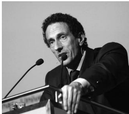
Prof. Dr. Julian Nida-Rümelin über den Akademisierungswahn