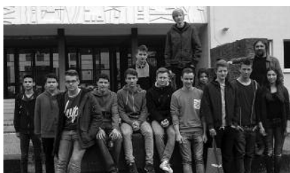
Berufsinformationstag in Würzburg.