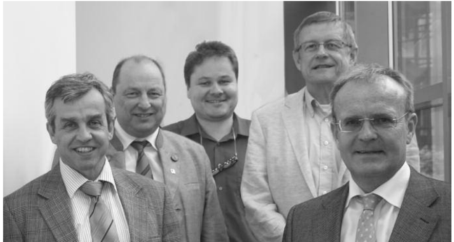
Die Mitglieder des Arbeitskreises Planungsmanagementsysteme

Einer der zentralen Vorteile liegt in der orts- und zeitunabhängigen Austauschmöglichkeit von Informationen. Außerdem wird der Aufwand für die Verteilung und Archivierung von Informationen reduziert, da Dokumente nur noch an einer Stelle abgelegt werden und allen autorisierten Empfängern zugänglich gemacht werden können, so Preuß weiter.