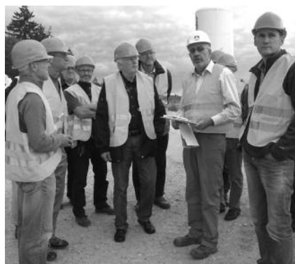
Die Teilnehmer der Exkursion