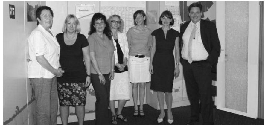
Die Bayerische Ingenieurekammer-Bau beim Info-Gespräch mit Vertretern des Versorgungswerks

Die Mitarbeiterinnen des Versorgungswerks beraten Sie gerne telefonisch oder im persönlichen Gespräch und geben Ihnen Auskunft darüber, warum sich die Mitgliedschaft lohnt, wie hoch die Beiträge sind und welche Leistungen Ihnen das Versorgungswerk bietet. „Offene Fragen lassen sich unserer Erfahrung nach am einfachsten im direkten Gespräch klären. Deswegen ermuntern wir alle Interessen-