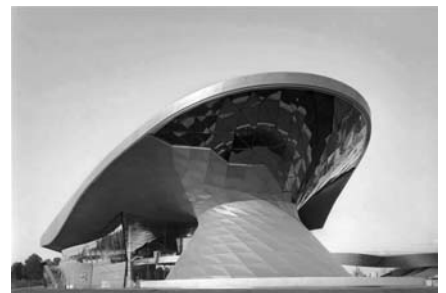
Die BMW-Welt in München wurde von 2003 bis 2007 errichtet.

Anschließend fand ein reger Austausch über Gesehenes und Gehörtes statt. Auch, dass viele Vorstandsmitglieder, Mitglieder von Arbeitskreisen und Ausschüssen der Bayerischen Ingenieurekammer-Bau anwesend waren verdeutlicht das Engagement der SSF Ingenieure, das weit über das normale Maß hinaus geht. gü