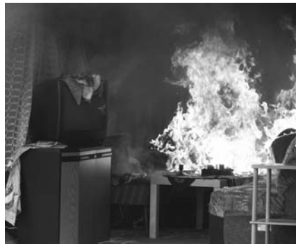
Das Bauordnungsrecht muss so sein, dass die Rettung von Personen und wirksamen Löschmaßnahmen möglich sind.

Das Grundsatzpapier wurde im Oktober 2008 sowohl von der Fachkommission Bauaufsicht als auch von den Gremien der Arbeitsgemeinschaft der Leiter der Berufsfeuerwehren in Deutschland - AGBF (Arbeitskreis Grundsatzfragen und Arbeitskreis Vorbeugender Brand- und Gefahrenschutz - AK VB/G) einstimmig und ohne Änderungen angenommen.