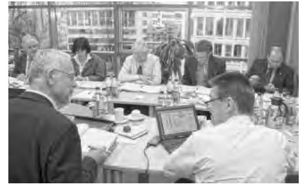
Die Mitglieder des Vorstands bei der letzten Sitzung

■ Die Ingenieurakademie Bayern hat ihr neues Fortbildungsprogramm für das zweite Halbjahr 2011 veröffentlicht. Neu ist ein Brandschutzlehrgang zum Erwerb der Nachweisberechtigung für die Gebäudeklasse 4. Der erste Lehr-