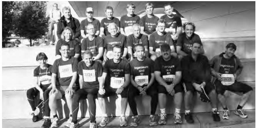
Ein Teil des Kammerteams beim Gruppenfoto vor dem Startschuss