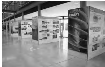
Eine Ausstellung informierte über die Renaturierung

Zur erfolgreichen Renaturierungen haben mehrere Teams bestehend u.a. aus Bauingenieuren, Landschafts- und Stadtplanern beigetragen. Einen maß-