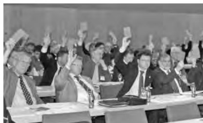
Mitglieder der Vertreterversammlung bei einer Abstimmung

Es freut mich sehr, dass sich 359 Kammermitglieder entschlossen haben, für einen Sitz in diesem Parlament der bayerischen Ingenieure zu kandidieren. Die Kandidatinnen und Kandidaten treten auf 15 Listen an – teils wurden diese von Ingenieurverbänden aufgestellt, teils handelt es sich um freie Vereinigungen. Das Engagement der Kandidaten zeigt, dass unsere Kammer eine le-