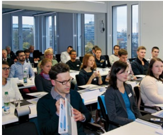
Alle Fotos zeigen die Teilnehmerinnen und Teilnehmer des Traineeprogramms 2015